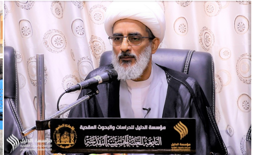
مؤسسة الدليل للدراسات والبحوث العقيدية شعبة العلاقات العامة والإعلام