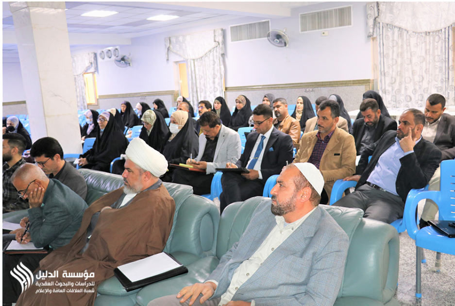
مؤسسة الدليل للدراسات والبحوث العقيدية شعبة العلاقات العامة والإعلام

وفي سياق متصل نظمت شعبة العلاقات العامة والإعلام معرضاً لإصدارات المؤسسة، وقد شهد في يومه الأول إقبالاً من المشاركين.